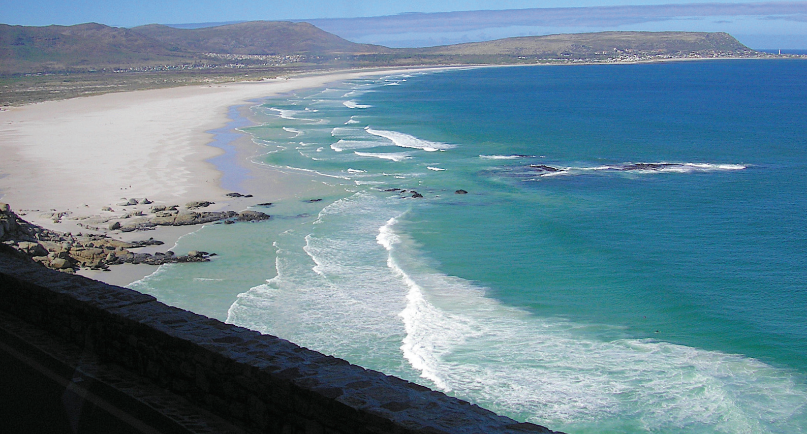
Udsigt mod Det indiske Ocean.