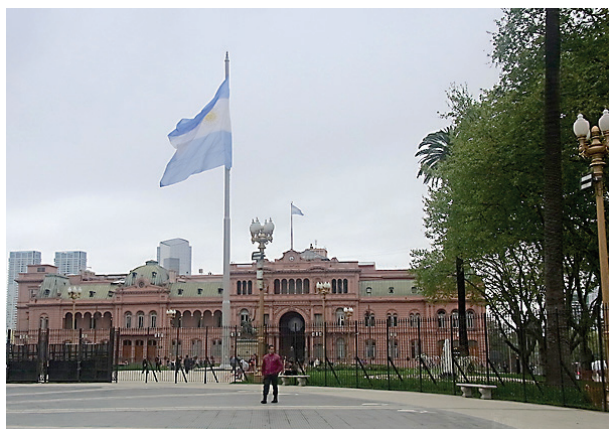
Det lyserøde palads, hvor Eva Perron holdt taler til folket.

Vi havde en heldags guide-tur med en god guide. Vi så et lyserøde Palads, hvor Eva Perron holdt tale til folket, og vi så hendes gravmonument på den berømte Recoleta Kirkegård, ligesom katedralen, hvor den nuværende Pave var præst.