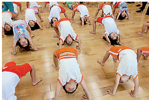
Børn laver gymnastik i børnehave