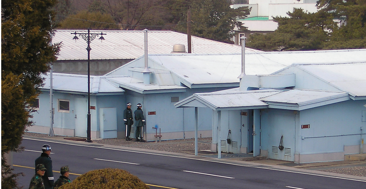
Grænsen mellem Nord- og Sydkorea