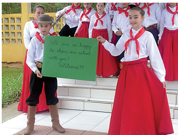
Børnene på skolen, vi besøgte

En aften var vi til et Tango-show med dejlig mad og (dyre) drinks. Man blev lidt stolt, da musikerne spillede Tango Jalousi af danske Jacob Gade, meget smukt og indlevende. (Jeg vælger at tro, musikerne vidste, der var dansk publikum 😊)