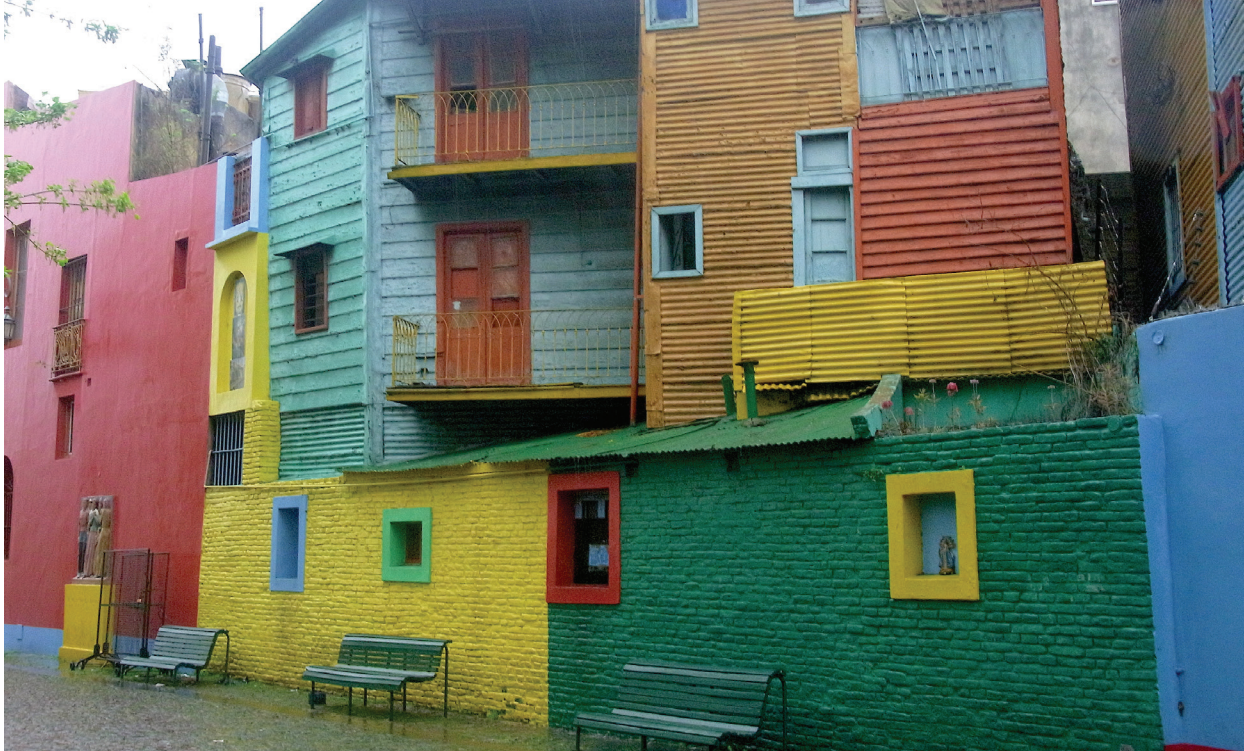
Fra San Telmo. Husene er malet med den forhåndenværende malerbøtte, når den var tom starter man på den næste bøtte, der kan skaffes