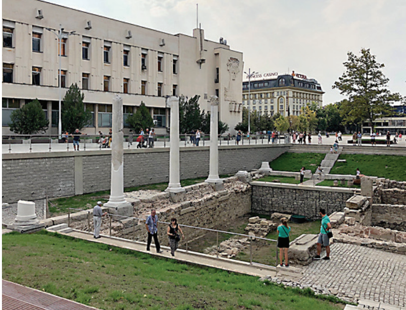
Udgravning i centrum i Plovdiv