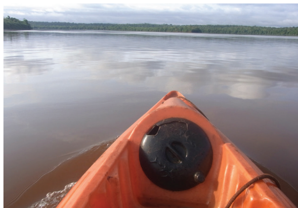
Kanotur på Iguazu-River. 65 km længere fremme kommer man til vandfaldet.

På ekskursion i junglen fandt vi flere orkide-rødder, som aberne have tabt i farten. Alt blev samlet ind, og på afrejsedagen var vi med til at fæstne dem på træerne omkring reservatet, og vi fik et bevis som naturplejere. Vi krydsede grænsen et par gange mellem Argentina og Brasilien for