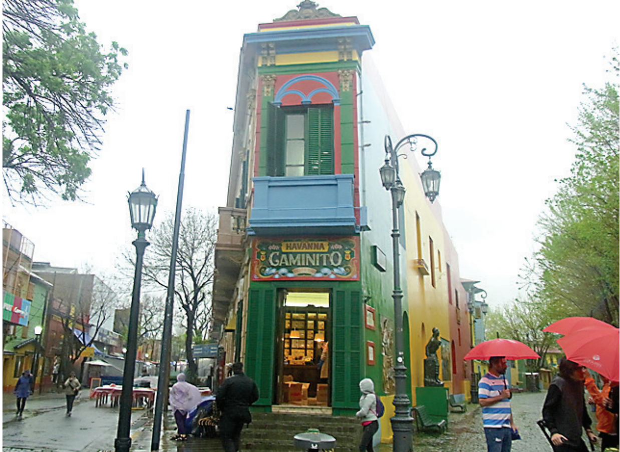
San Telmo i regnvejr