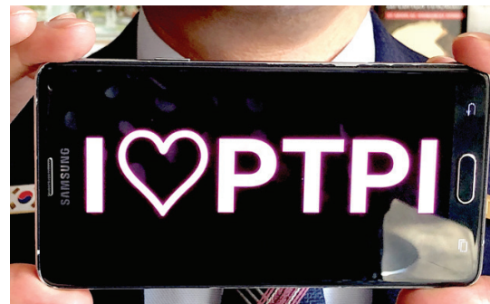
PTP-ven fra Korea viser sin telefon