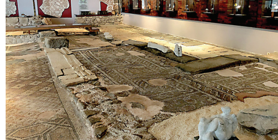
Fra kulturcenter i Plovdiv.