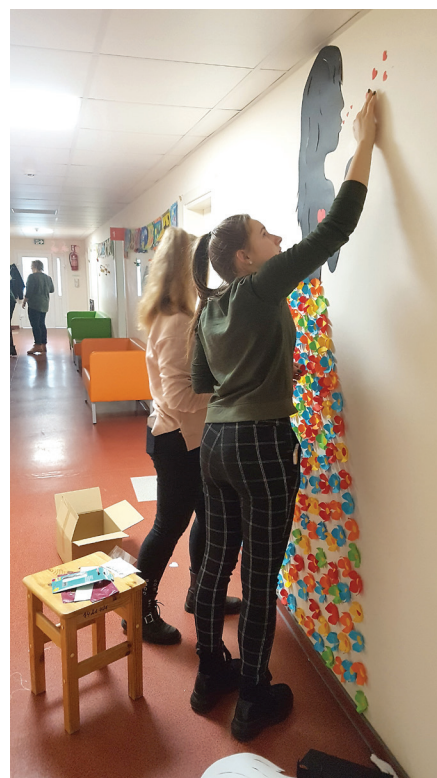
Et børnehospital i Litauen får væggene dekoreret af unge PtP-medlemmer.

Det giver et helt specielt forhold til et land. For nu ved vi, at der bor rigtige mennesker der – lige som os.