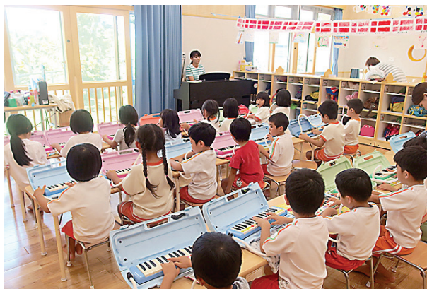
Børn lærer at spille på melodika, 5 år.