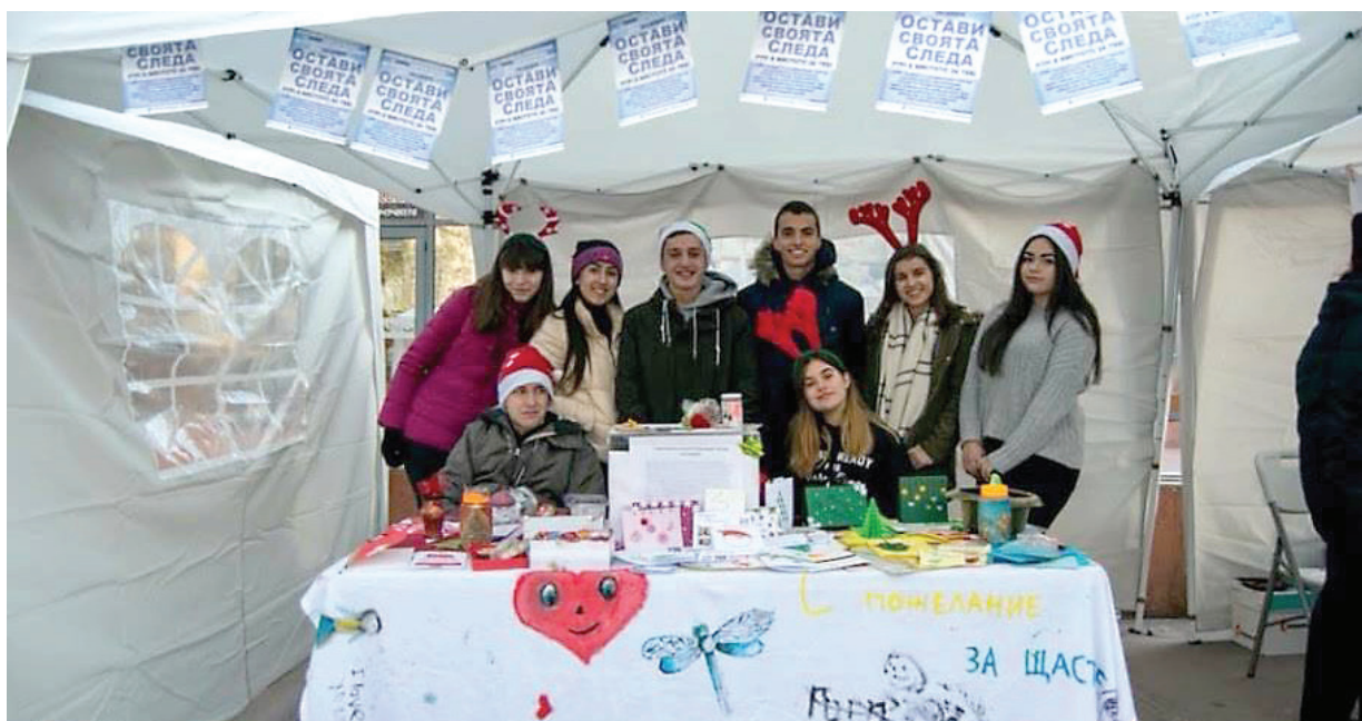
Her har Plovdiv studenter chapter gang i julesalget.

- Det er en spændende proces. For det kræver, at man sætter sig grundigt ind i temaerne, og får ideer til at omsætte dem til noget, man kan forstå og bruge i praksis, fortalte de.