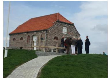
Japanere i Danmark